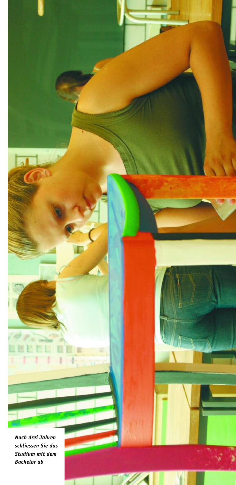
Nach drei Jahren schliessen Sie das Studium mit dem Bachelor ab

* Erläuterungen unter: www.zhwin.ch/departement-g