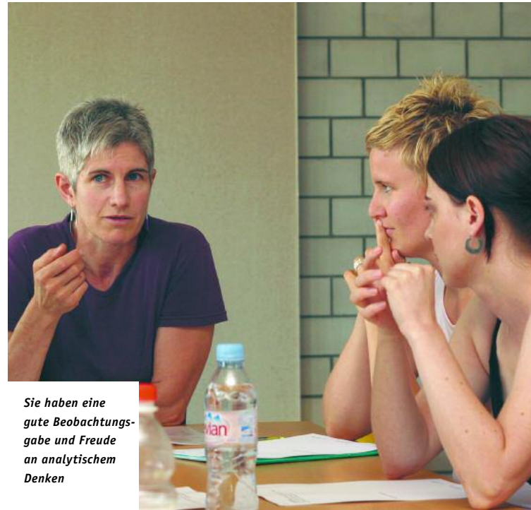
Sie haben eine gute Beobachtungsgabe und Freude an analytischem Denken

Sie sind belastbar, haben eine gute Beobachtungsgabe und Freude an analytischem Denken. Sie verfügen über Eigeninitiative, Flexibilität, die Fähigkeit zur Selbstreflexion und arbeiten gern im Team.